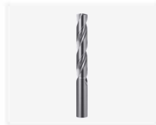
드릴 비트 8mm