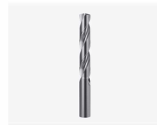
드릴 비트 10mm